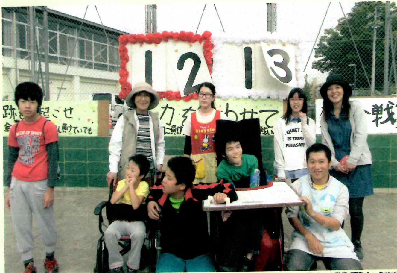
岩井屋を利用する子どもたちと職員（運動会への参加）