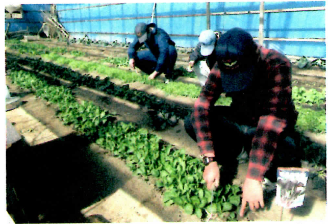
岩井屋農園の作業風景

園に触発されて、休耕地を活用した畑が次々と現れており、地域の活性化にも貢献することができたという。